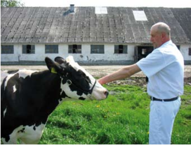
Lewa ręka za mocno wyprostowana

Ramię powinno znajdować się na takiej samej wysokości co głowa jałówki, łokieć lekko ugięty, nie za mocno wyprostowany i nie uniesiony za wysoko. Przedramię osoby prowadzącej stanowi przedłużenie linii głowy zwierzęcia.