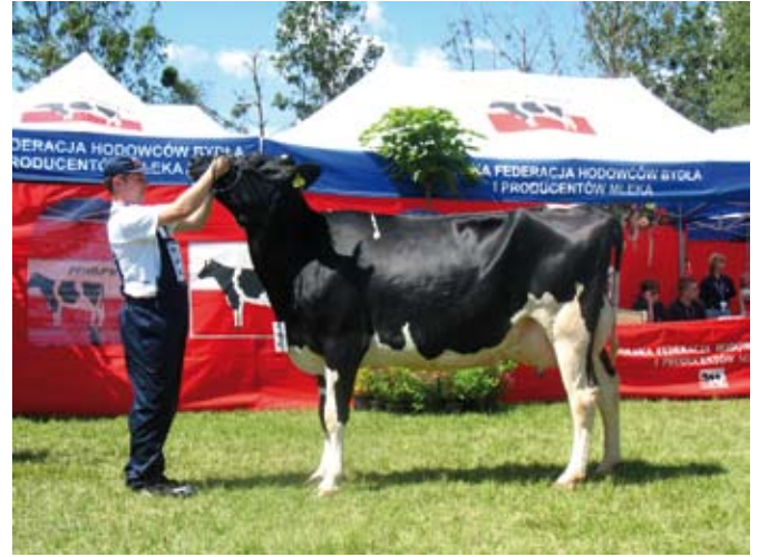
Zbyt wysoko trzymane ręce sprawiają, że głowa jest nienaturalnie uniesiona