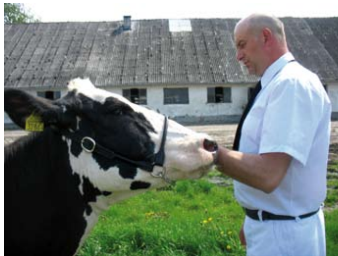
Prawidłowa pozycja ramienia trzymającego presenterkę

Ważną sprawą jest ocenić mocne i słabe strony jałówki.