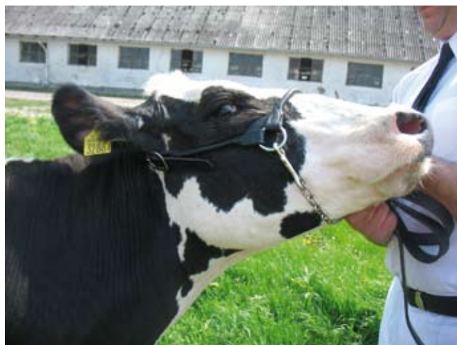
Prezenterka za mała