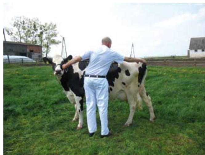
Sposób wyprostowania grzbietu i repozycji ogona

Po zakończeniu indywidualnej oceny każdej jałówki, sędzia zaczyna ustawiać zwierzęta w linii na środku ringu. Jeśli otrzymamy sygnał, aby podejść, trzeba szybko przeprowadzić zwierzę energicznym krokiem we wskazane miejsce w tworzonej linii.