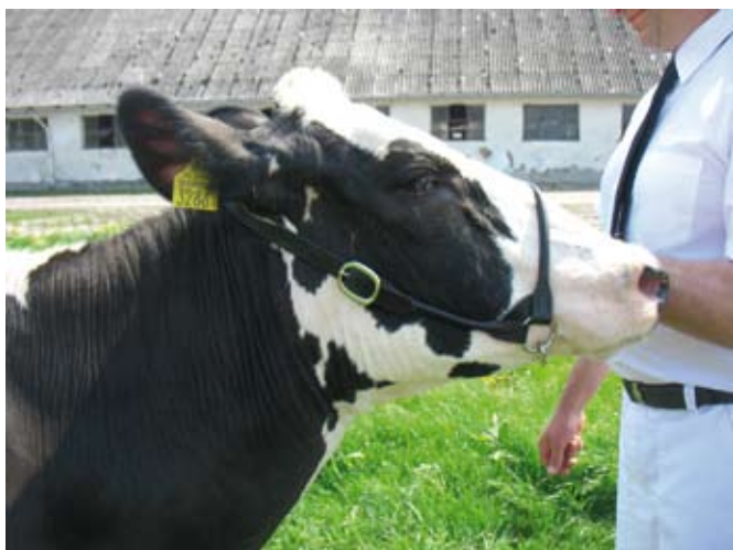
Prezenterka zbyt duża