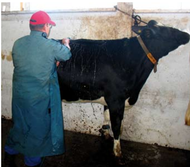
Zanim przystąpimy do mycia jałówkę trzeba bardzo dokładnie zmoczyć wodą