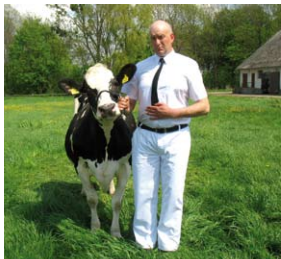
Prawidłowo ubrany oprowadzający

Wprowadzając zwierzę na ring oprowadzający po- winien być ubrany starannie, czysto i schludnie. Utrzy- manie czystości białej odzieży przed wyjściem na ring może nie być łatwe, dlatego dobrze jest mieć kom- binezon ochronny, który można zdjąć przed samym wyjściem na ring.