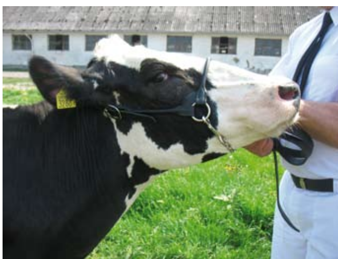
Prawidłowo dopasowana prezenterka

Twoja lewa ręka powinna ściśle przylegać do głowy cielęcia, bo wówczas kantarka nie wchodzi jej do oka, a gdyby jałówka nie była trzymana dość mocno, przeraziła się nagle i zaczęła skakać do tyłu – prezenterka prawdopodobnie zostanie nam w ręce.