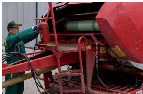
Przed eksploatacją prasę należy wyposażyć w atestowaną gaśnicę.