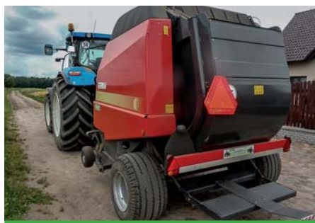
Przejazd po drodze publicznej z prasą wyposażoną w światła i trójkątną tablicę.