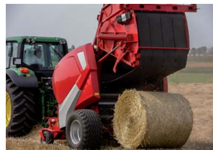
Podczas wyładunku beł na nierównym terenie należy zachować szczególną ostrożność.

Sworzeń zaczepowy zabezpieczony przed wypadnięciem.